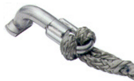
T-Aug-Beschlag f. Seldén-Halteplatten

Wenn das untere Auge mit einem Schäkel verbunden wird, sollte eine Stahlkausch eingearbeitet werden.